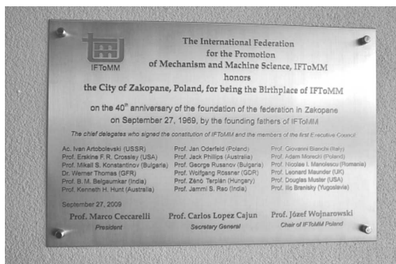
Tablica upamiętniająca powstanie Federacji IFToMM